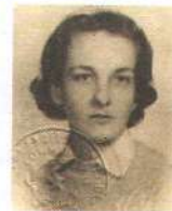
Rossana Rossanda da ragazza in una foto tessera e, sopra, a una manifestazione femminista

Infine Venezia, la città dove Rossanda trascorse l'adolescenza e a cui si sentì sempre particolarmente legata. Dal 3 maggio all'Istituto veneziano per la Storia della Resistenza - dove già da qualche anno è allestita una ricostruzione dello studio e della biblioteca della giornalista - una mostra di foto e documenti a cura di Giulia Albanese ripercorrerà la lunga vita della Ragazza del Novecento ( iveser.it ). □