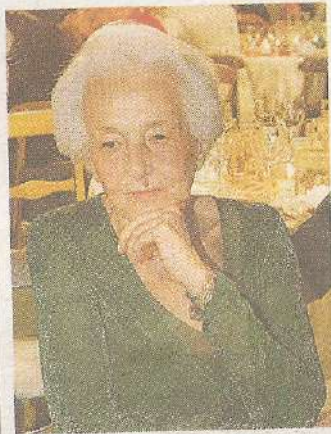
Intellettuale Rossana Rossanda