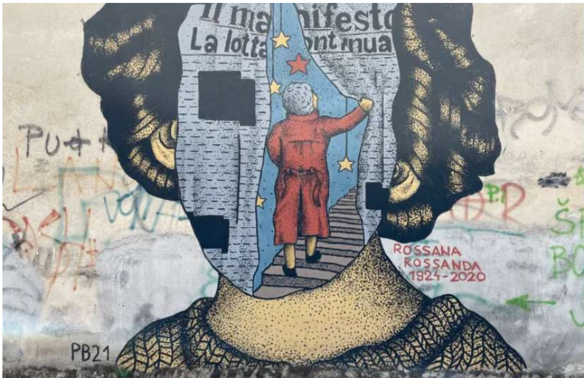
Il murale per Rossana Rossanda a Pula di YaboyL.

Due giorni per celebrare il centenario della nascita di una figura centrale del panorama politico e culturale italiano del Novecento, distintasi per la sua critica al socialismo reale e per il suo impegno in difesa dei diritti del lavoro e dell'ambiente. Il 22 e 23 aprile a Roma si svolgerà un convegno e un tributo artistico nel suo ricordo