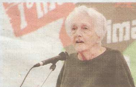
Centenario Rossana Rossanda, nata nel 1924

Nata a Pola il 23 aprile 1924, Rossana Rossanda sarà infatti al centro sia di un convegno che di un omaggio artistico, entrambi organizzati da un comitato promotore composto dall'Istituto veneziano per la storia della Resistenza e della società contemporanea (Iveser), dall'Archivio di Stato di Firenze, dall'Archivio di Stato di Roma e dal sito di informazione economica Sbilanciamoci.info . L'evento si avvale inoltre del patrocinio del Comune di Roma. Il convegno “Rossana per noi” si terrà nella sala Alessandrina dell'Archivio di Stato di Roma, in corso Rinascimento 5, e si articola in due sessioni: la prima lunedì 22 aprile, dalle 14.30 alle 19, la seconda martedì 23 aprile, dalle 9.30 alle 14. L'evento, a ingresso gratuito e con diretta streaming su rossanarossanda.it , un nuovo sito che verrà lanciato per l'occasione, prevede gli interventi di Doriana Ricci, coordinatrice del Comitato promotore, storica collaboratrice e intima amica di Rossanda, Giulia Albanese dell'Iveser, Michele Di Sivo dell'Archivio di Stato, Mario Pianta di Sbilanciamoci.info e di circa 40 personalità della politica, della cultura e della società civile, tra cui